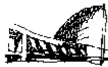
Tavola: 10 sostitutiva